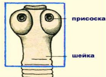
головка с присосками